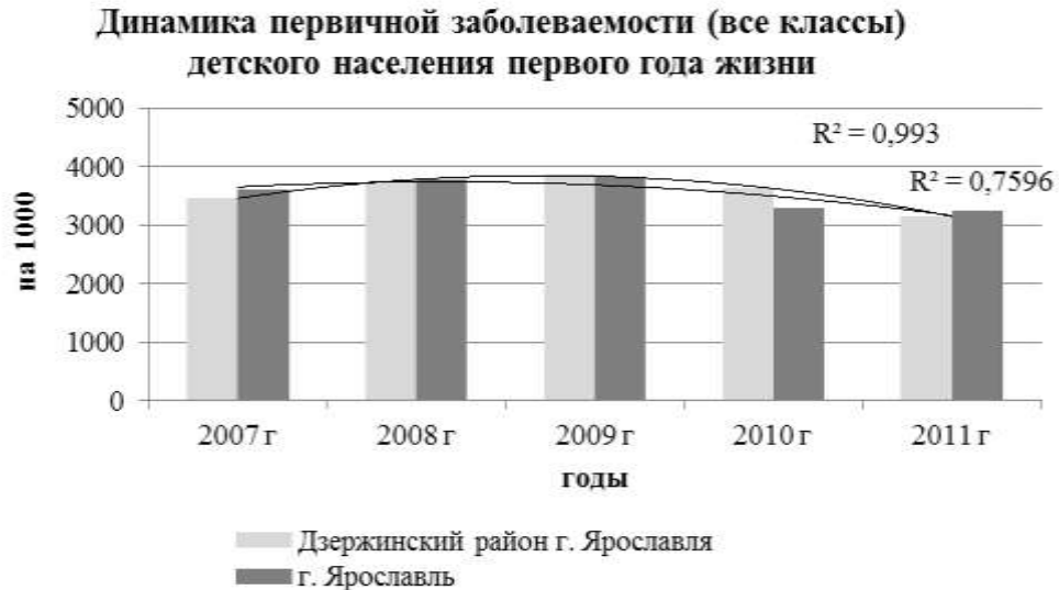
Рис. 1. Динамика первичной заболеваемости детского населения первого года жизни в Дзержинском районе г. Ярославля и г. Ярославле в 2007-2011 гг.

В период эпидемического подъема гриппа H1N1 в 2009-2010 гг. заболеваемость органов дыхания у младенцев в Дзержинском районе была достоверно выше, чем в г. Ярославле. Темп роста в районе составил 37,5% против городского - 10%, в том числе по острым респираторным инфекциям, гриппу, пневмонии на 27,9% в районе, на 7,8% в городе ( p=0,00000 ) (рис. 2.).