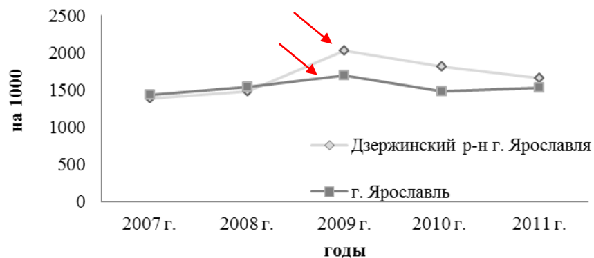
Рис. 2. Динамика первичной заболеваемости (болезни органов дыхания) детского населения первого года жизни Дзержинского района г. Ярославля и г. Ярославля в 2007-2011 гг.