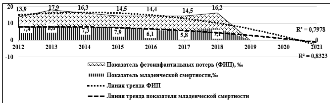
Рисунок 3. Динамика изменения показателей фетоинфантильных потерь в Забайкальском крае за период 2012-2018 гг. (%)

По результатам изучения изменения уровня заболеваемости по обращаемости детского населения в медицинские организации за период с 2012 по 2018 гг. установлена негативная динамика. Уровень первичной заболеваемости детей первого года жизни сократился с 459,2‰ до 299,9‰ (темп убыли -34,7%), общей заболеваемости - с 700,9‰ до 529,8‰ (темп убыли -24,5%). Уровень первичной заболеваемости детей в возрасте от 0 до 14 лет снизился с 1763,37‰ до 1719,18‰ (темп убыли -2,5%), общей заболеваемости - с 2211,86‰ до 2119,06‰ (темп убыли -4,2%). Полученные результаты указывают на наличие проблем в вопросах организации и оказания доступной ПМСП детскому населению, а также отражают недостаточный уровень медицинской и профилактической активности населения.