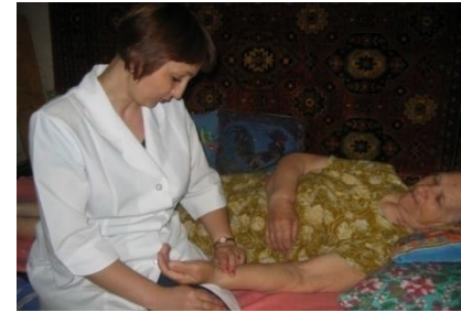
Медсестра на дому