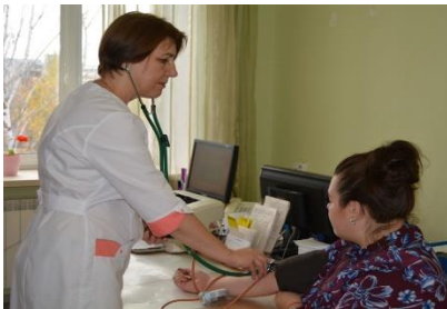
Медсестра на самостоятельном приеме