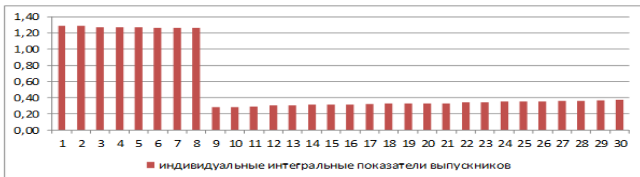
Рисунок 2 - Сравнительные данные интегральных показателей результатов освоения основной профессиональной образовательной программы

Рассчитан индивидуальный интегральный показатель для каждого выпускника (рисунок 2). По результатам анализа у 100% выпускников значения интегральных показателей не вышли за допустимые значения нижней границы нормы. У 8 выпускников значения индивидуальных интегральных показателей расположены выше верхней границы нормы и в 3,7 раза превышают значения по группе.